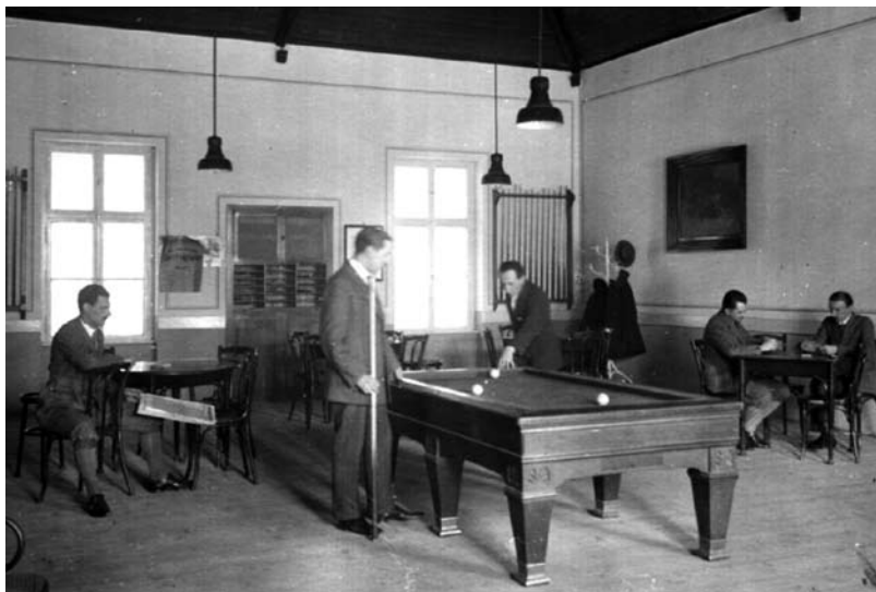
3. kép Az acélgáryi Munkás Kaszinó biliárdterme az 1930-as évek közepén. Dornyay Béla Múzeum Fényképtára ltsz. 2432.

A nyilvános terek használatának vizsgálatakor az utcakép mellett mindenképpen szót érdemelnek a szabadidő eltöltésére szolgáló nyílt és zárt terek is. A vállalat igyekezett szervezett szabadidővel távol tartani munkásait a politizálás veszélyeitől, ezért sportolásra és kikapcsolódásra egyaránt alkalmas tereket alakítottak ki. A férfiak szabadidejüket legszívesebben a Munkás Kaszinóban, vagy más néven Olvasóban és a nyári kuglizóban töltötték el. A kuglizó kerthelyiségében tavasztól ősziig szívesen időztek. „Az olvasó-egylet tulajdonképpen munkás-kaszinó, ahol billiárdterem, ivószoba, kuglizóhelyiség és kert van a tagok használatára, de emellett nemesebb irányú szórakozásra is nyújt alkalmat.” 8