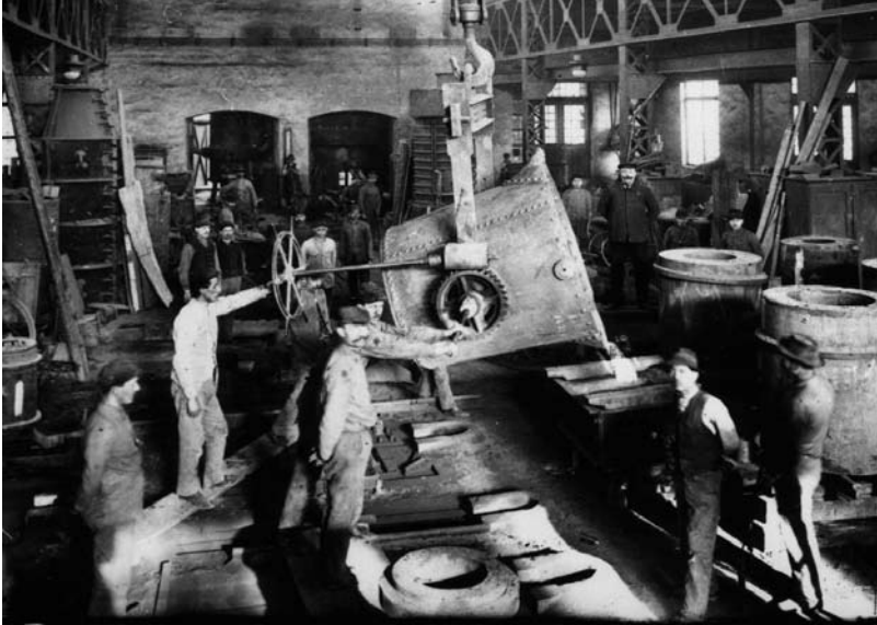
4. kép Acélgyáriak munka közben az 1930-as években. Dornay Béla Múzeum Fotótára 2428.

Az üvegyárnál szintén igyekeztek jólöltözöttek lenni, elsősorban nem is az igényekben mutatkozott meg a két kolónia lakossága közötti különbség, hanem a lehetőségekben. Az interjúk alapján úgy tűnik, hogy még egy üvegfúvó családban is csak maximum három vagy négy pár cipővel rendelkeztek, inkább sapkát hordtak kalap helyett, és bár báli alkalmakra itt is szmokingot öltöttek a férfiak, a ruhadarabok száma jelentősen kevesebb volt, mint az acélgyáriak esetében. Tehát nem a ruhák minőségében volt különbség, hanem a mennyiségében, ebből fakadóan előbb is lettek viseltesek, hiszen nem volt lehetőségük a gyakori cserére.