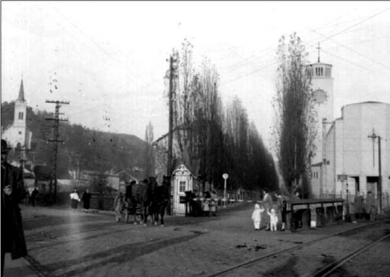
1. kép A fősorompó az Acélgyári út elején az 1940-es évek első felében. ltsz. 1623.

volt, a lakóházaik is szebbek és kényelmesebbek voltak, mint a bányakolónián, mégsem volt olyan makulátlan, mint az Acélgyári út. Kérdésemre, hogy mennyire különbözött az acélgyári városrész az üvegyáritól, azt válaszolta: